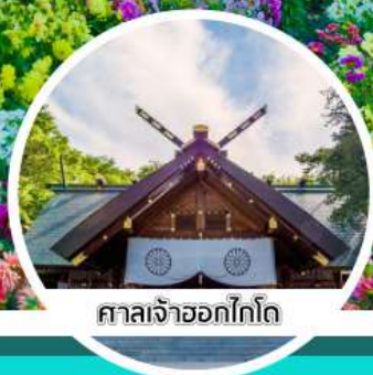
ศาลเจ้าออกไกโด