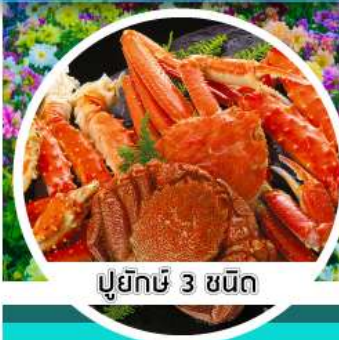
ปูยักษ์ 3 ชนิด

6 / 7 / 13 / 14 / 20 พ.ค.63 21 / 27 / 28 พ.ค.63 3 / 4 / 10 / 11 มิ.ย.63 17 / 18 / 24 / 25 มิ.ย.63