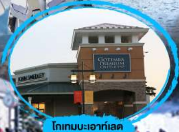
โทเทบะเอาก์เลต