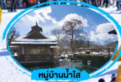
หมู่บ้านน้ำใส