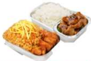
บริการอาหารร้อน ไป-กลับ บนเครื่อง

** เนื่องจากเป็นตั๋วเครื่องบิน จึงไม่สามารถตรวจสอบอาหารได้ **