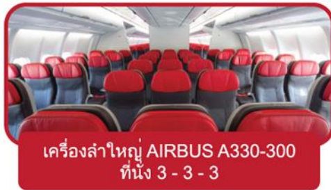
เครื่องลำใหญ่ AIRBUS A330-300 ที่นั่ง 3 - 3 - 3

01.00 น. ออกเดินทางสู่ ท่าอากาศยานนานาชาติ นาริตะ ประเทศญี่ปุ่น โดยสายบิน THAI LION AIR เที่ยวบินที่ SL 300