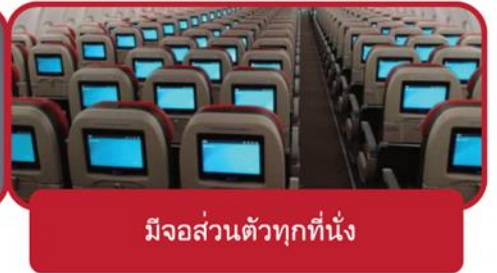
มีจอส่วนตัวทุกที่นั่ง