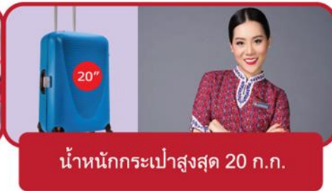
น้ำหนักกระเป๋าสูงสุด 20 ก.ก.