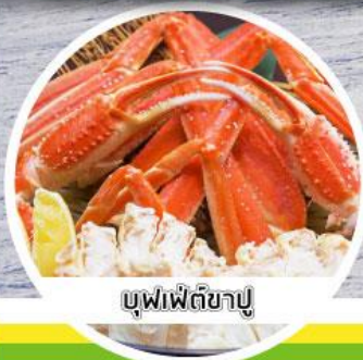
บุฟเฟ่ต์ขาปู