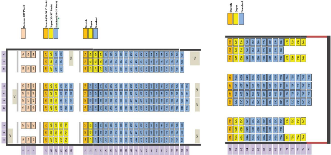
Seat Map : Boeing 777-300