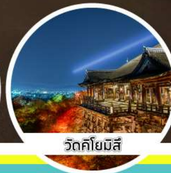
วัดคิโยมิตสึ