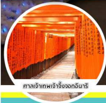
ศาลเจ้าเทพเจ้าจิ้งจอกอินาริ