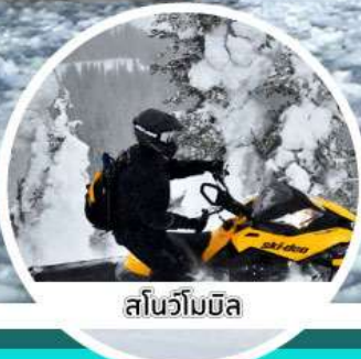
สโนว์โมบิล