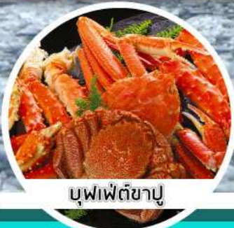
บุฟเฟ่ต์ขาปู