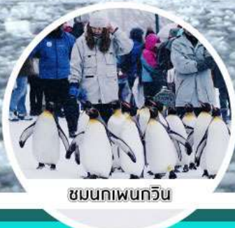
ชมนกเพนกวิน