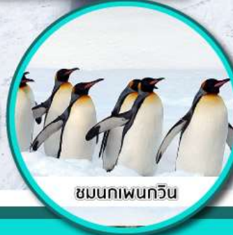
ชมนกเพนกวิน