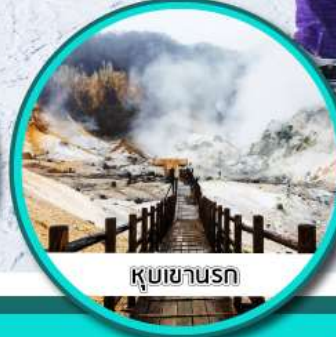
คุบเขานรท