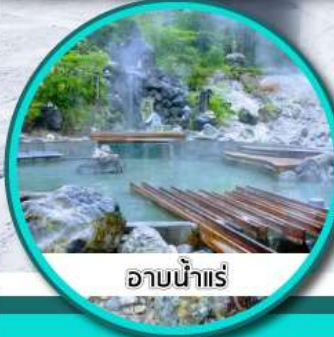
อาบน้าแร่