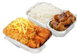
บริการอาหารร้อน ไป-กลับ บนเครื่อง

** เนื่องจากเป็นตัวจับ จึงไม่สามารถดูเมนูอาหารได้**