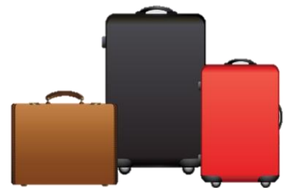
น้ำหนักกระเป๋า 20 กิโลกรัมต่อท่าน

** เนื่องจากเป็นตัวจับ จึงไม่สามารถดูเมนูอาหารได้**