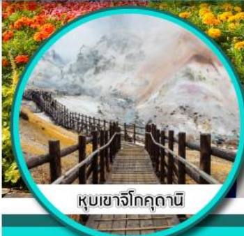
หุบเขาริโถคุดานิ