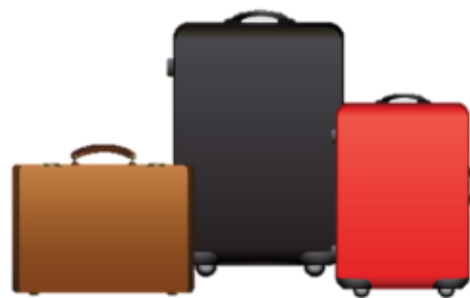
น้ำหนักกระเป๋า 20 กิโลกรัมต่อ

** เนื่องจากรวมตั๋วเครื่องบินจึงไม่สามารถรวมอาหารเช้า **