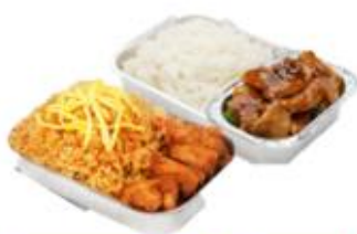
บริการอาหารร้อน ไป-กลับ บนเครื่อง

** เนื่องจากรวมตั๋วเครื่องบินจึงไม่สามารถรวมอาหารเช้า **