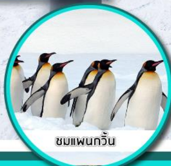
ชมเพนกวิน