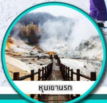
คุบซานรท