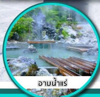
ออนน้ำแร่