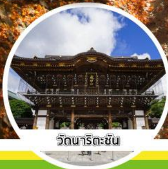
วัดนาริตะชิน