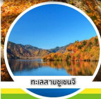
ทะเลสาบชูเซนจิ