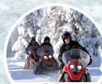
สโนว์โอบิล