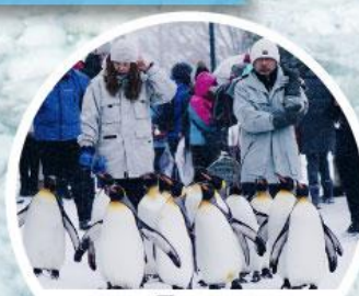
เพนกวินพาร์ค