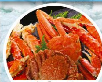
ปูยักษ์ 3 ชนิด