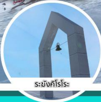
ระฆังศิโรราบะ