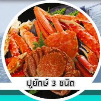
ปูยักษ์ 3 ชนิด