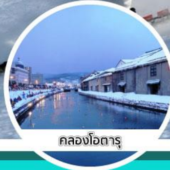
คลองโอดารุ