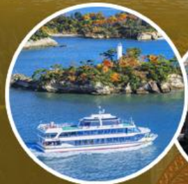
ชมอ่าวมัตสึชิม่า