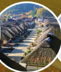
หมู่บ้านโออุจูกุ