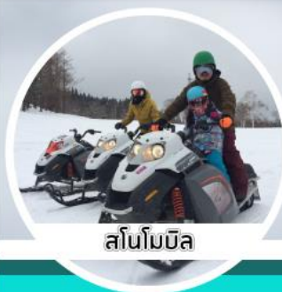
สโนว์โมบิล