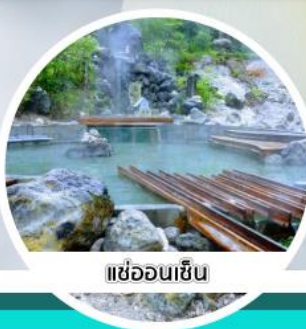
แช่ออนเซ็น