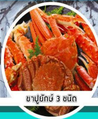
ชาปูยักษ์ 3 ชนิด