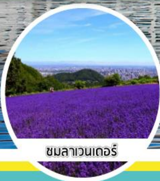
ชมลาเวนเดอร์