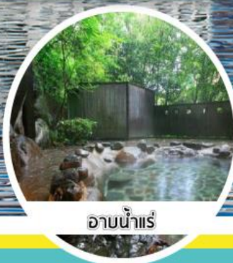
อาบน้ำแร่