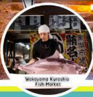
Wakayama Kurashio Fish Market