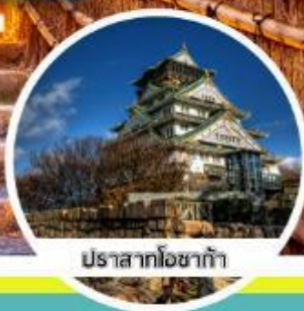
ปราสาทโอซาก้า