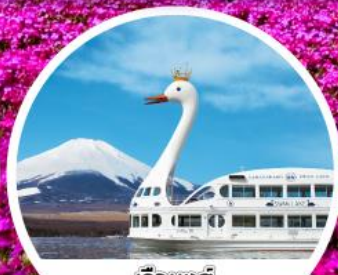
เรือหงส์