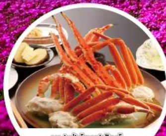
บุฟเฟ่ต์ขาปูยักษ์