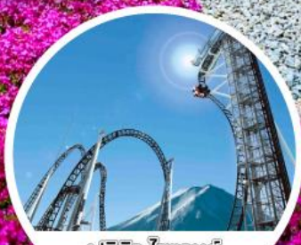
ฟูจิคว โฮแลนด์