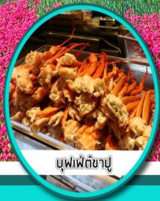
บุฟเฟ่ต์ซาซุ