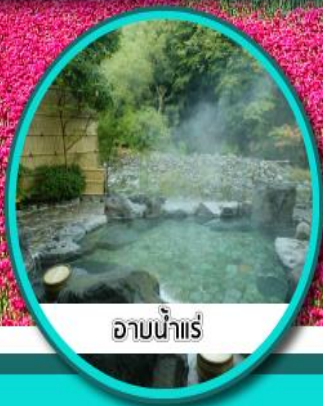
อาบน้ำแร่