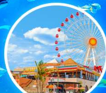
หมู่บ้านอเมริกัน