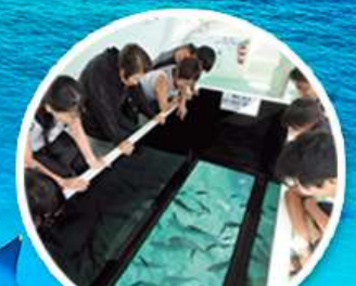
ล่องเรือกระจก