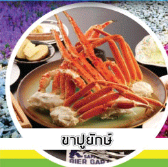
ขาปูยักษ์