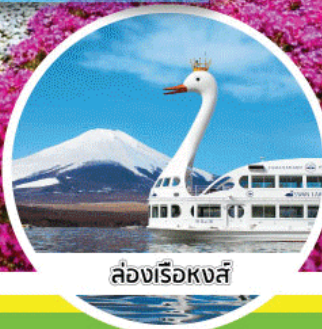
สวองเรือหงส์