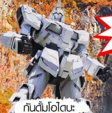
กันดั้มโอโตเมะ

พิเศษ!! บุปเฟ่ต์ชาบูยักษ์+แช่ออนเซ็นธรรมชาติฉบับญี่ปุ่น