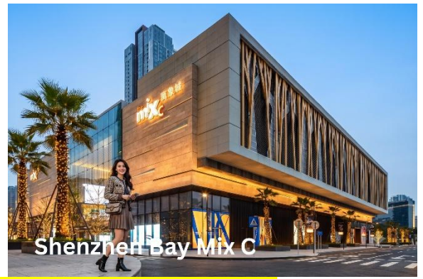
Shenzhen Bay Mix C

จากนั้นอิสระ Shenzhen Bay MixC เป็นศูนย์การค้าสุดหรู ระดับไฮเอนด์ริมอ่าวเซินเจิ้น ภายในโดดเด่นด้วย สถาปัตยกรรมสุดล้ำ งานศิลปะ และแบรนด์แฟชั่นชั้นนำ ระดับโลก แบรินด์ดีไซเนอร์ และสตรีทแฟชั่น เช่น กระเป๋า แบรินด์อิตอย่าง Songmont หรือร้านเสื้อผ้าไลฟ์สไตล์ เซ็คอินจุดถ่ายรูปยอดเยี่ยม งานศิลปะไอคอนิกอย่างรูปปั้นช้าง และสถาปัตยกรรมตึกระฟ้า China Resources Tower