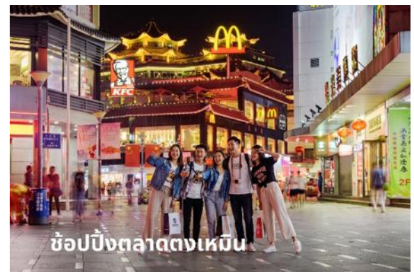
ช้อปปิ้งตลาดตงเหมิน

นำท่านชม ศูนย์สมุนไพรจีน แหล่ง คั้นคว้ายาแผนโบราณ ที่เราเรียกว่า บั้วหิมะ ยาประจำบ้านที่มีชื่อเสียงและมีสรรพคุณมากมาย และแวะร้านหยก เลือกชมและเลือกซื้อผลิตภัณฑ์จากหยกสินค้าขึ้นชื่อของจีน