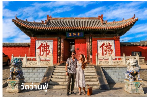
วัดว่านฟู

นำท่านเดินทางสู่ วัดว่านฟู (Wanfo Temple) ตั้งอยู่ทางตอนใต้ของสวนสาธารณะตงหู (East Lake Park) ในเขตห้าวู เมืองเซินเจิ้น ภายในประดิษฐานพระพุทธรูปสี่พักตร์ สัญลักษณ์ของความรัก การงาน ความสงบสุข และความมั่งคั่ง ดึงดูดผู้ศรัทธาจำนวนมากให้มาสักการะ ขอพรเรื่องโชคลาภและความสงบสุข นอกจากนี้ภายในวัดแห่งนี้มีห้องอ่านหนังสือที่เต็มไปด้วยหนังสือโบราณหลากหลายประเภท การได้ฟังเสียงสวดมนต์และพลิกหน้าหนังสือทำให้ฉันรู้สึกผ่อนคลายและสงบอย่างแท้จริง เป็นประสบการณ์ที่น่ารื่นรมย์อย่างยิ่ง