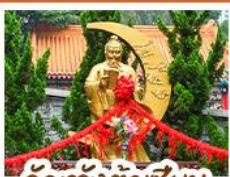
วัดเข่งต๋าเซียน

พอร์เชกครบทั้ง 3 องค์ เรื่องโชคลาภ การเงินและธุรกิจ • นั่งกระเช้าแองปัง สักการะพระใหญ่เทียนตาม • เจ้าแม่กวนอิมฮ่องฮ่า ขอเรื่องเงิน ทรัพย์สิน ความมั่งคั่งเจ้าแม่กวนอิมริมทะเล ขอพรเรื่องความสำเร็จ จดเปิดเป่าสิ่งไม่ดี พักโรงแรม 4 ดาว แหล่งช้อปปิ้ง...ผ่านจิมซาจุ่ยหรือย่านมงกิก