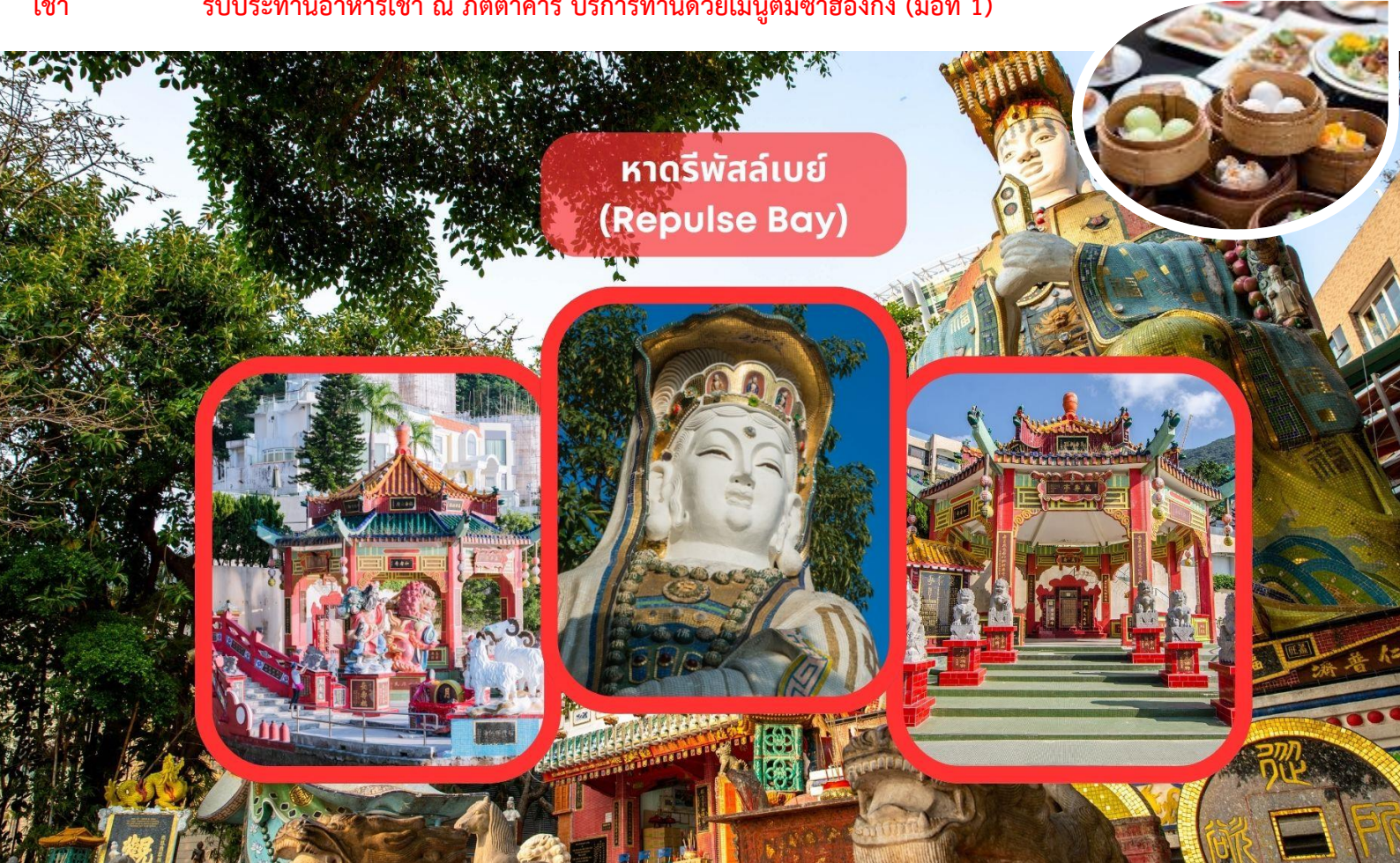
หาดรีพัลส์เบย์ (Repulse Bay)

รับประทานอาหารเช้า ณ ภัตตาคาร บริการท่านด้วยเมนูติ่มซำฮ่องกง (มื้อที่ 1)