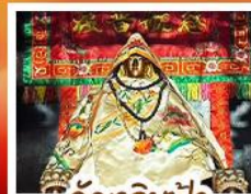
วัดฉีฉีฟ้า