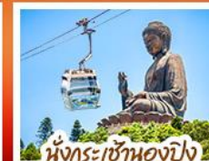
นั่งกระเช้าแองปัง พระใหญ่เกาะคิมเตา