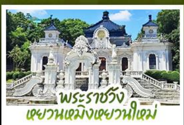
พระราชวัง เฉวานเหมิงเฉวานไห้เหม