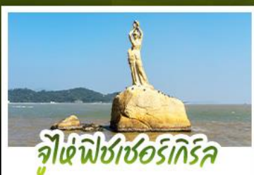
จุไห้พิงซอร์เกิร์ล