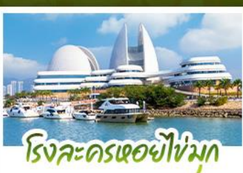
โรงละครเมย์ไห้เม