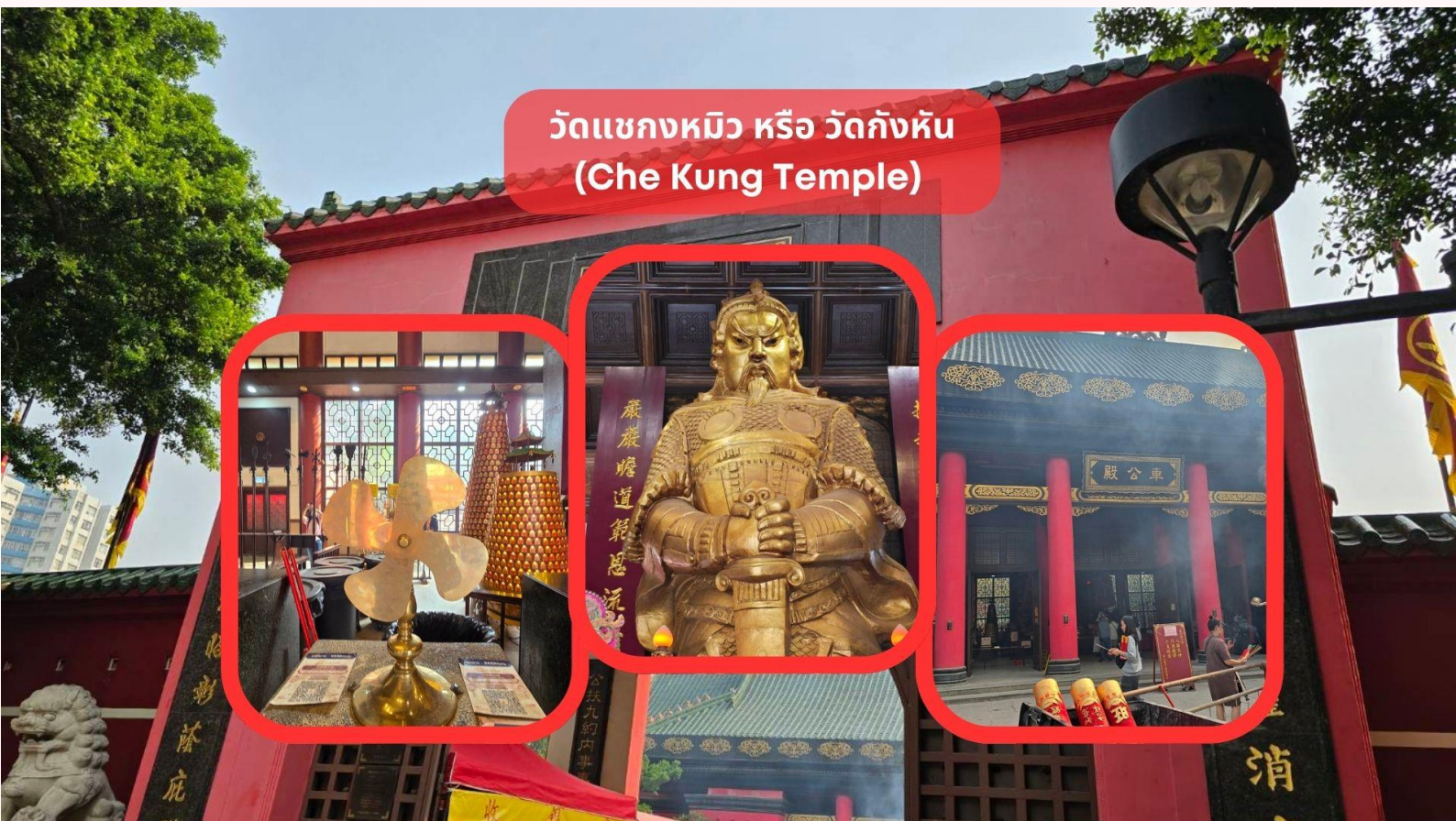
วัดแชกงหมิว หรือ วัดกังหัน (Che Kung Temple)

จากนั้นนำท่านชม ร้านหยก มีสินค้ามากมายเกี่ยวกับหยก อาทิกำไลหยก หรือสัตว์นำโชคอย่างปี่เสี่ยะ อีสระให้ได้ เลือกซื้อเป็นของฝาก หรือเป็นของที่ระลึกนำโชคแต่ตัวเอง