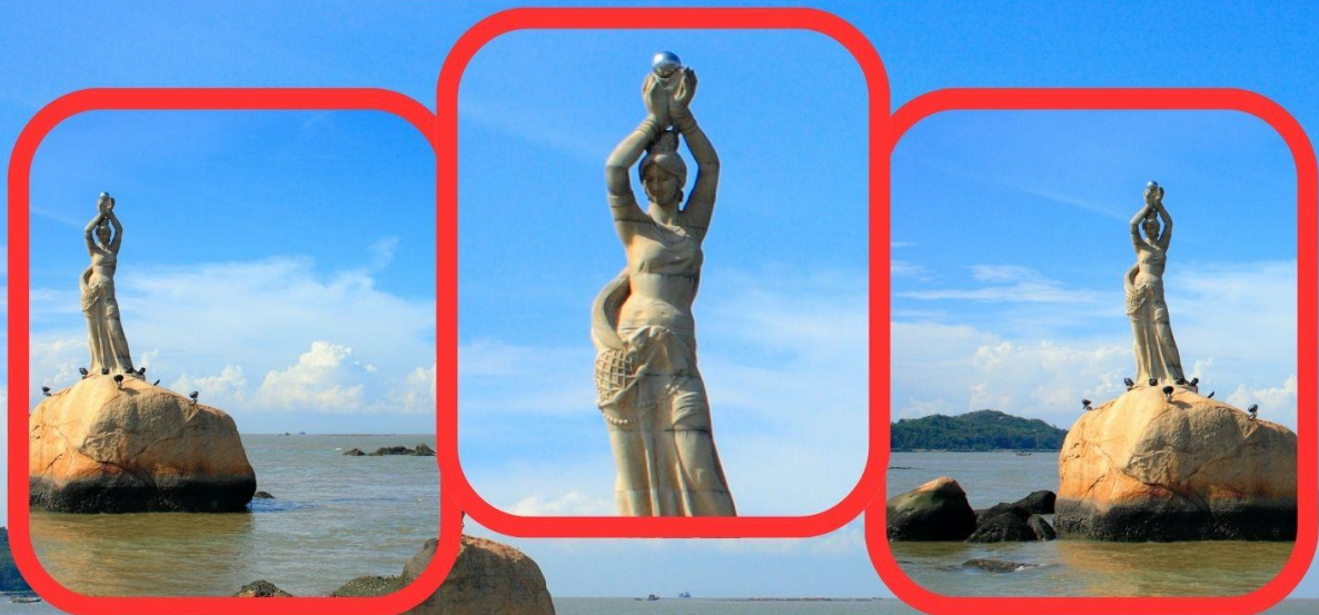
จูไห่ ฟิชเชอร์ เกิร์ล (Zhuhai Fisher Girl)

รับประทานอาหารเช้า ณ ห้องอาหารของโรงแรม (มื้อที่ 4)