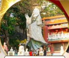
เจ้าแม่กวนอิมรีพลัสเบย์