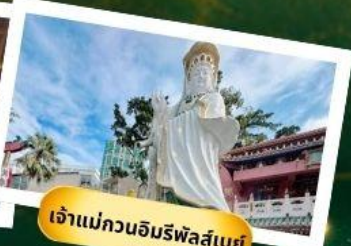
เจ้าแม่กวนอิมริพัลส์เซย์