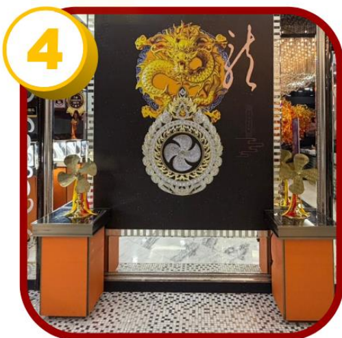
ศูนย์ฮวงจู้กั๊งหัน