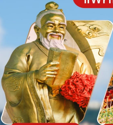
WONG TAI SIN