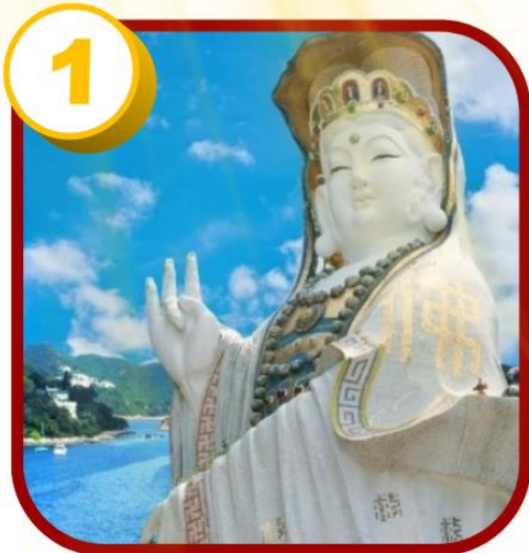
รีพัลส์เบย์