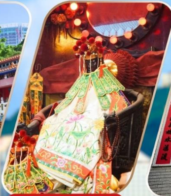
KWAN YUM HH