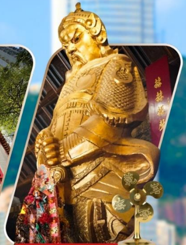
CHE KUNG (SHA TIN)