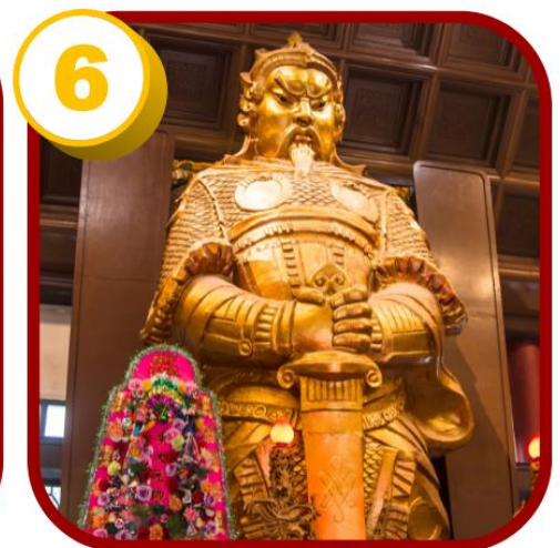
วัดแชกง (ซ่าถิ้น)