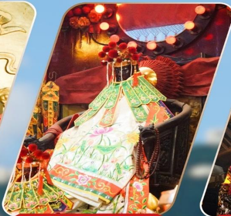
KWAN YUM HH