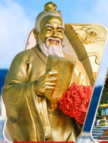
WONG TAI SIN