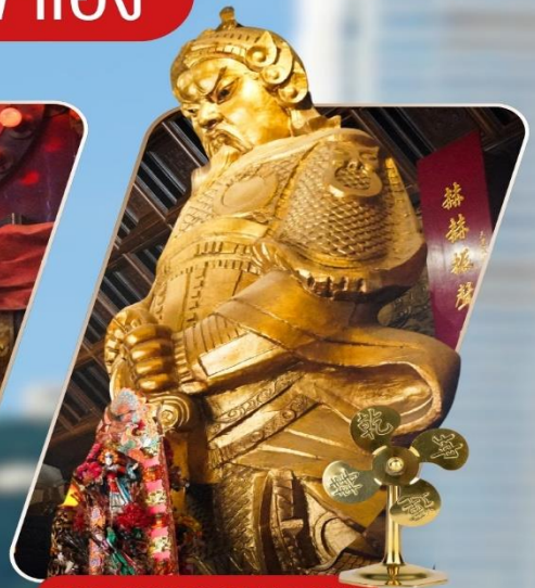
CHE KUNG (SHA TIN)