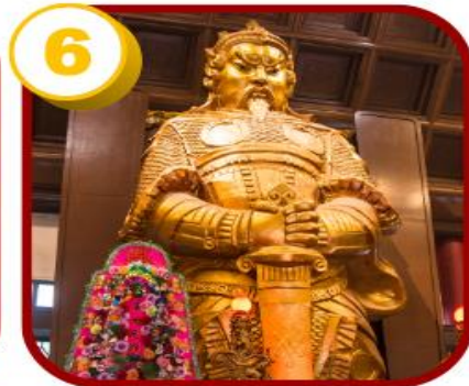
วัดแซกง (ซ่าถิ้น)