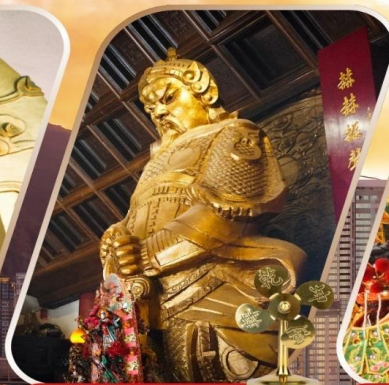
CHE KUNG (SHA TIN)