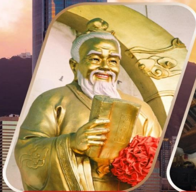
WONG TAI SIN