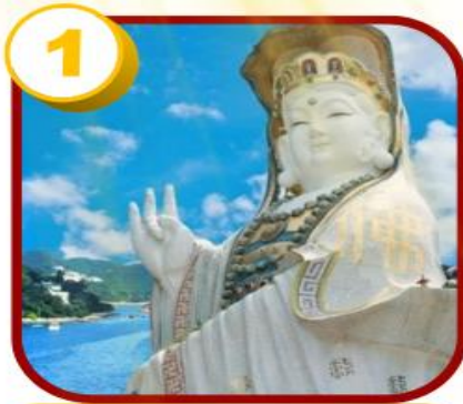
รีพลัสเบย์