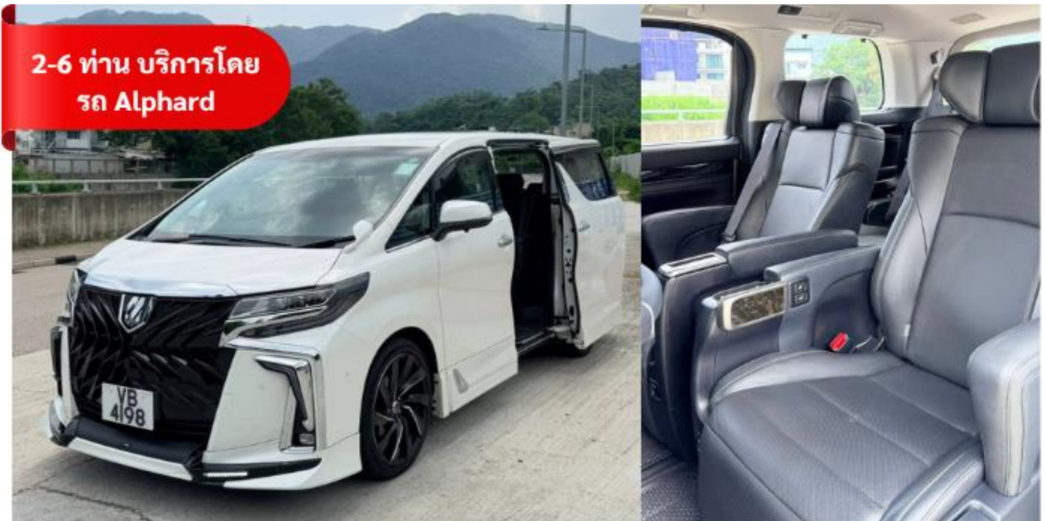
2-6 ท่าน บริการโดย รถ Alphard

** คอนเฟิร์มโรงแรม 3 วันก่อนเดินทาง ในกรณีโรงแรมที่เสนอเต็มบริษัทขอสงวนสิทธิ์ เปลี่ยนเป็นโรงแรมอื่น 3 ดาวตามมาตรฐานฮ่องกง โดยไม่ต้องแจ้งให้ทราบล่วงหน้า **