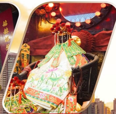
KWAN YUM HH