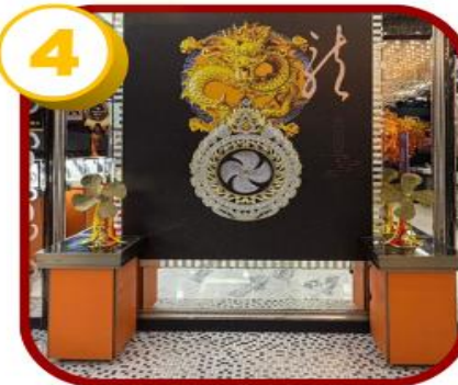
ศูนย์ฮวงจู้กั๊กหัน