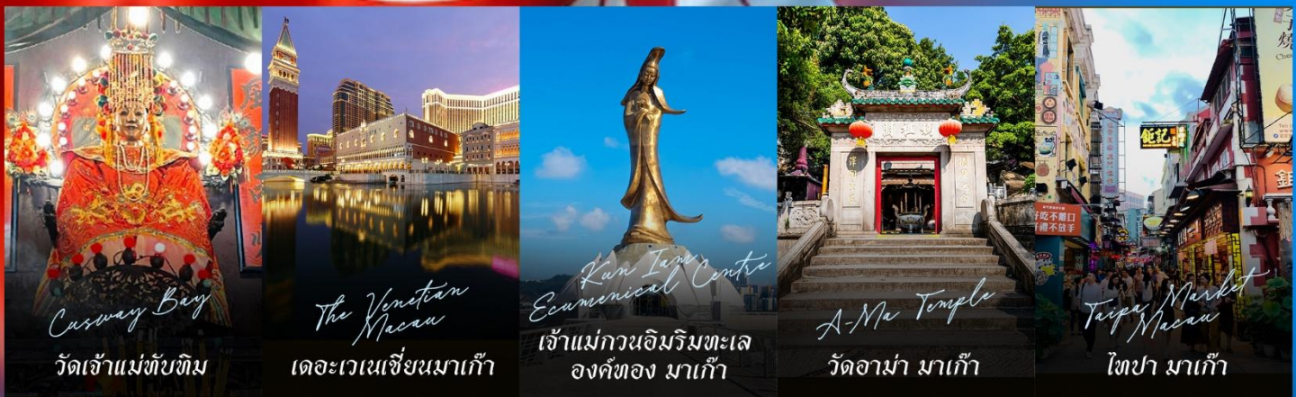
Casway Bay วัดเจ้าแม่ทับทิม

รายการทัวร์ข้างต้นอาจมีการปรับเปลี่ยนเพื่อความเหมาะสม