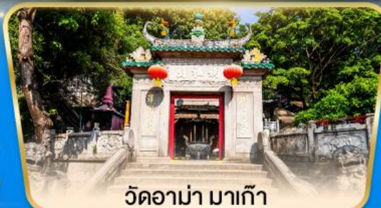
วัดอาม่า มาเก๊า