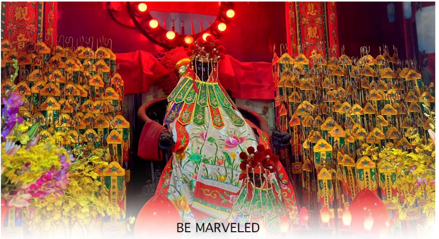
BE MARVELED วัดเจ้าแม่กวนอิมฮวงอ้า (ยิมฮิน)

ให้เดินทางกลับไปกราบไหว้ และขอบคุณเจ้าแม่กวนอิมอีกครั้ง โดยเตรียมชุดไหว้ และกระดาษาเงินกระดาษาทอง ที่เป็นเหมือนเงินที่เรานำมาคืน เป็นการไหว้เพื่อคืนเงินเจ้าแม่กวนอิมนั่นเอง