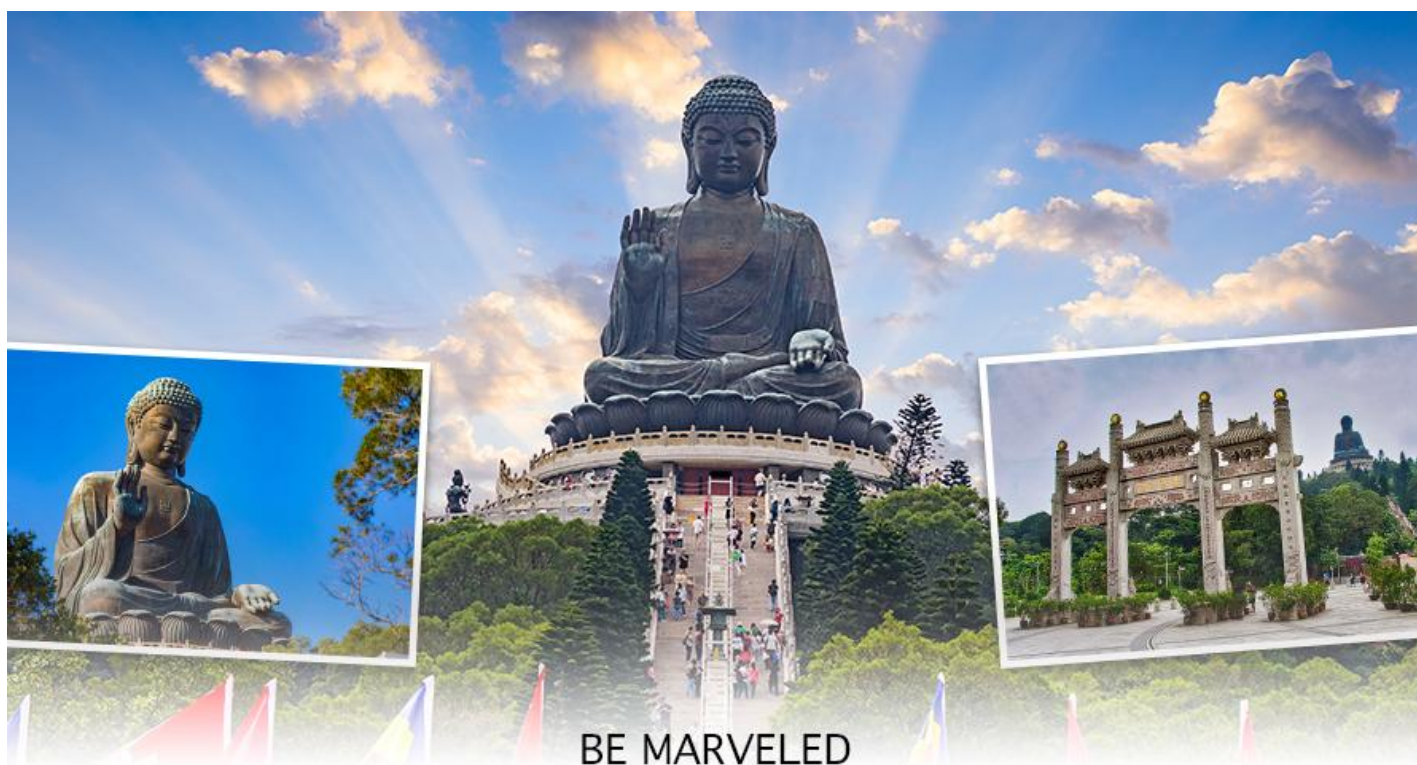
BE MARVELED พระใหญ่เทียนถาน

ใหญ่อย่างใกล้ชิดนั้น ต้องเดินขึ้นบันได จำนวน 268 ขั้นและได้รับเลือกให้เป็นสิ่งมหัศจรรย์ทางวิศวกรรมชั้นที่ 4 จากทั้งหมด 10 ชั้นของฮ่องกงในปี ค.ศ. 2000 ถือเป็นพระพุทธรูปองค์ใหญ่ที่เป็นสุดยอดของประติมากรรมทางพุทธศาสนาที่มีการผสมผสานระหว่างศิลปะสำริดแบบดั้งเดิมกับเทคโนโลยีสมัยใหม่ ชาวฮ่องกงเชื่อว่า หากใครได้มานมัสการขอพรองค์พระใหญ่แห่งนี้แล้ว ชีวิตก็จะมีแต่ความโชคดี มีความสุขสมหวัง และประสบความสำเร็จในทุกๆด้าน หลังจากไหว้พระแล้วท่านสามารถเลือกซื้อของฝาก, ของที่ระลึก จากหมู่บ้านนองปิง อาทิเช่น หยก ไข่มุก หรือเครื่องประดับคริสตัล เพื่อเป็นของที่ระลึก จากนั้นนั่งกระเช้ากลับลงมายังสถานีตุงซุง