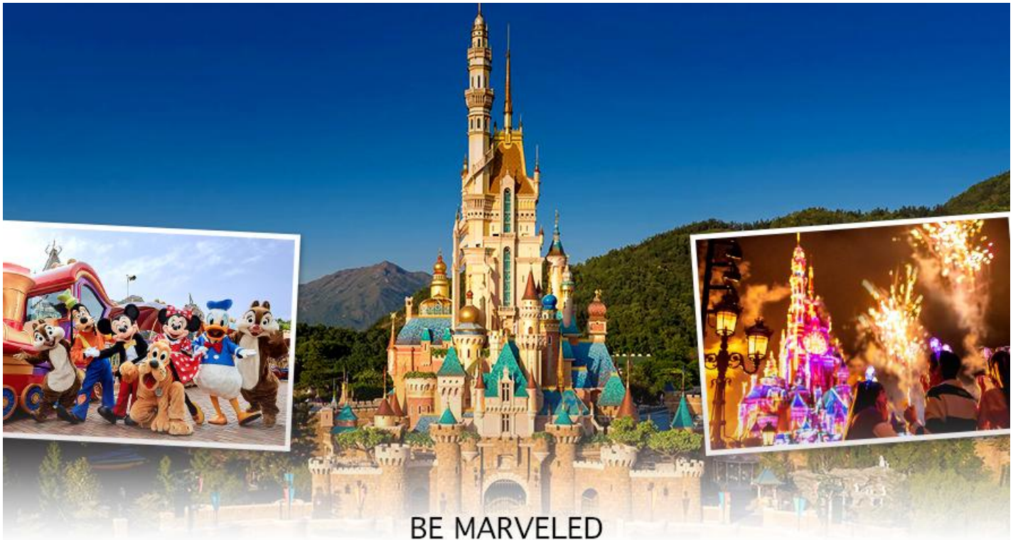
BE MARVELED HONG KONG DISNEYLAND

- Flights of Fantasy Parade ขบวนพาเหรดของบรรดาเหล่าตัวการ์ตูนดิสนีย์