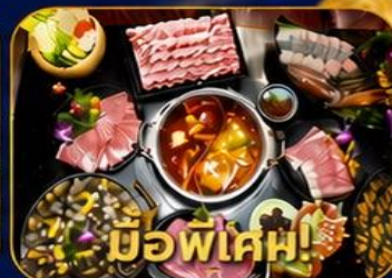
บุฟเฟ่ต์ชาบูสโด้ฮ่องกง