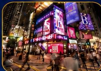
ซอปปิงชินซาฮุย

วัดเจ้าแม่กวนอิมฮ่องกง - ซอปปิงชินซาฮุย - วัดนาจา วัดแชกงหมิว - วัดหวังต้าเซียน