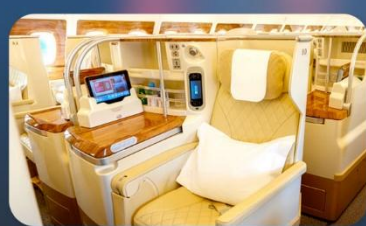
BUSINESS CLASS "บินกลับ"