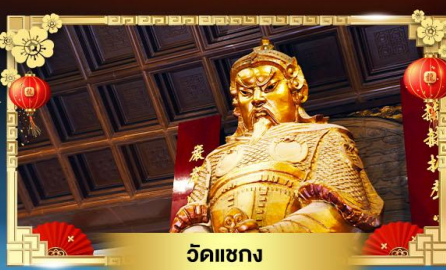
วัดเขากง