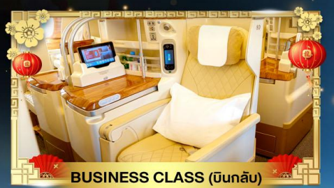
BUSINESS CLASS (บินกลับ)