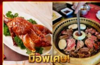
เปิดอย่างฮ่องกง บุฟเฟ่ต์บึงย่างเกาหลี