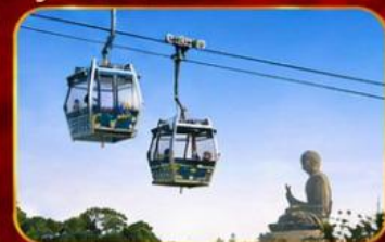
กระเช้านองปิง