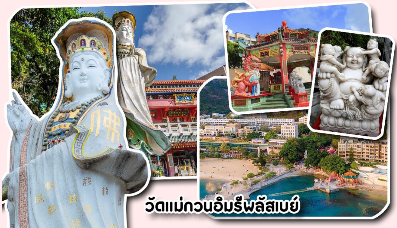
วัดแม่กวนอิมรีพลัสเบย์

อยากได้ลูกสาวให้ลู่บ่ท้องขวา ถัดมาคือ เจ้าแม่ทับทิมเทพีแห่งท้องทะเล ท่านจะคอยคุ้มครองผู้เดินทางทางเรือ หรือผู้ที่เดินทางไปไหนมาไหนท่านจะคอยคุ้มครองให้ปลอดภัย และมีโชคลาภ ถัดจากบริเวณที่กราบไหว้ขอพร ก็จะมีศาลาแปดเหลี่ยมริมน้ำ และสะพานเล็กๆ ที่ชื่อว่าสะพานต่ออายุ ซึ่งเชื่อกันว่าหากเดินข้ามสะพานแห่งนี้ 1 ครั้ง ก็จะมีอายุยืนขึ้น 3 ปี