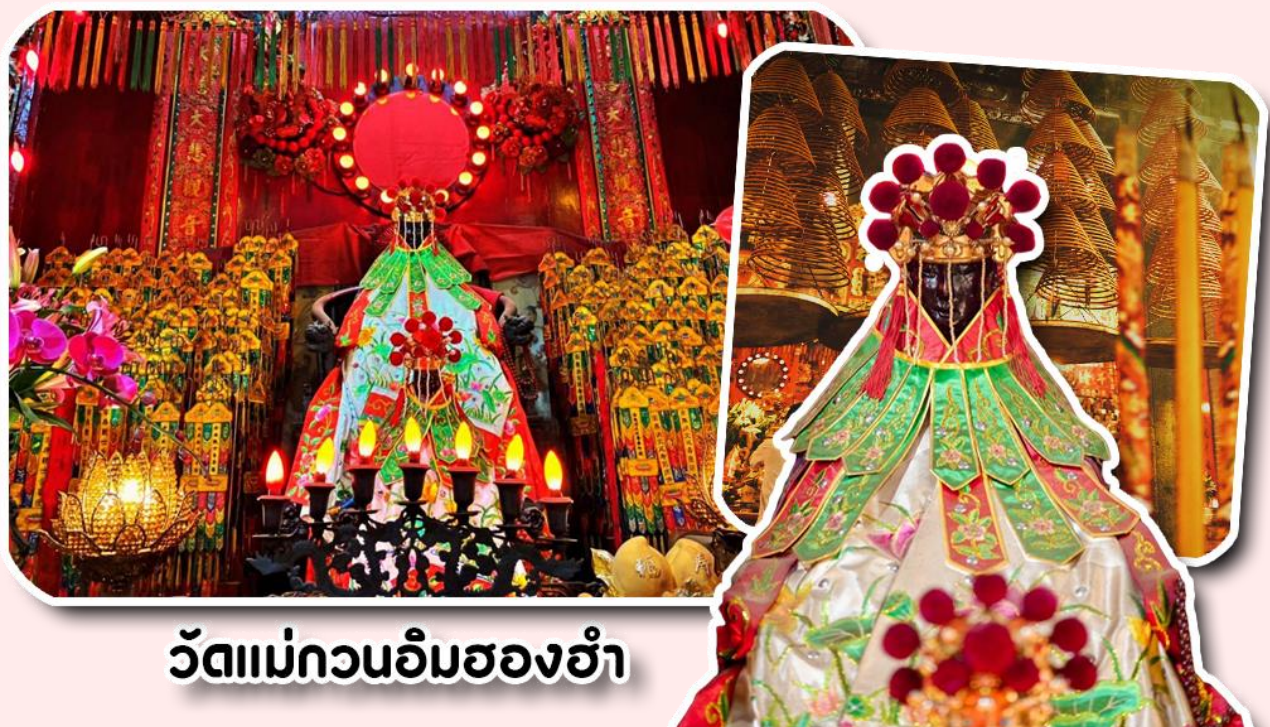
วัดแม่กวนอิมฮองฮำ

พาท่านเดินทางไปไหว้ขอพรขอเงิน วัดแม่กวนอิมฮองฮำ วัดเก่าแก่ของฮ่องกงสร้างตั้งแต่ปี ค.ศ. 1873 เป็นวัดขนาดเล็กที่มีชาวฮ่องกงศรัทธานับถือกันเป็นอย่างมาก วัดแห่งนี้เป็นที่ประดิษฐาน องค์เจ้าแม่กวนอิมฮองฮำ ที่มีชื่อเสียงเรื่องการให้กู้ยืมเงิน เชื่อกันว่าท่านช่วยพลิกฟื้นเศรษฐกิจของชาวฮ่องกง ผู้คนจึงนิยมมายืมเงินทำธุรกิจจนสำเร็จร่ำรวย รุ่งเรือง โดยให้ท่านอธิษฐานขอพรต่อหน้าเจ้าแม่กวนอิมฮองฮำ พร้อมกับระบุวันเวลาในการขอพรด้วย จากนั้นนำธนบัตรตามฐานะและศรัทธาที่เราจะนำเป็นสื่อในการขอพร เขียนจำนวนเงินที่ต้องการลงไปด้วย ใส่สกุลเงินยี่งดีใหญ่ แล้วนำเงินใส่ในซองแดง ควรเตรียมซองแดงไปเอง นำซองแดงไปวนรอบกระถางธูป วนขวาจำนวน 3 ครั้ง แล้วเก็บซองแดงในกระเป๋าสตางค์ เป็นเงินขวัญถุง ถ้าประสบความสำเร็จตามที่มุ่งหวัง ให้นำเงินในซองแดงทำบุญหยอดตู้ที่วัดแห่งนี้ในโอกาสต่อไป วิธีไหว้ให้ปัง ให้ได้โชคลาภเงินทอง ต้องไปกับเราเท่านั้น