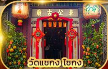
วัดเขากง ไชกง