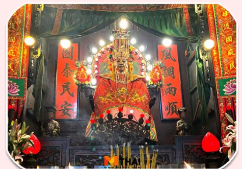
นางฟ้าพามู

จากนั้นเดินทางไปที่ วัดทินหัว (วัดเจ้าแม่ทับทิม) เป็นวัดเก่าแกในฮ่องกง สมัยก่อนฮ่องกงเป็นหมู่บ้านชาวประมง ซึ่งคนจะให้ความ