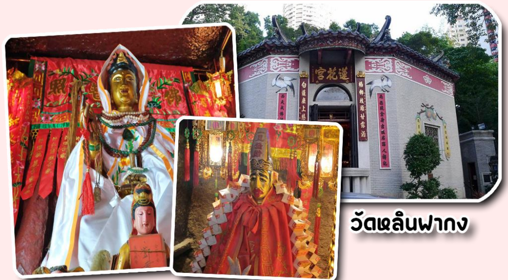
วัดหลินฟาง

พาท่านเดินทางไป วัดหลินฟ้า หรือ วัดดอกบัว เป็นวัดที่อยู่บริเวณหว่านจ่าย ทางทิศตะวันออกเฉียงเหนือของคอสเวย์เบย์ โดยวัดนี้จะถูกก่อสร้างในช่วงราชวงศ์ชิงหรือ ปี ค.ศ. 1963 มีการบูรณะอีกครั้งในปี ค.ศ 1986 และ 1999 มีเจ้าแม่กวนอิมเป็นองค์ประธานของวัด โดยมีตำนานเล่าว่า เจ้าแม่กวนอิมเคยมาปรากฏตัวที่วัดแห่งนี้ ชาวบ้านจึงเลื่อมใสศรัทธา จนรวมใจกันสร้างวิหารดอกบัวและประดับด้วยโคมดอกบัวต่างๆ เพื่อเป็นการบูชาและสักการะ นอกจากนี้ทางวัดหลินฟ้าก็ยังมี เทพเจ้าฮ่าวจื่อเฮียะ หรือเทพเจ้าสายนรก เป็นเทพเจ้าที่ขึ้นชื่อเรื่องกตัญญูที่มาในรูปลักษณะการนุ่งห่ม ผ้าดิบ ซึ่งเป็นสัญลักษณ์ของการไว้ทุกข์ที่คนเชื้อสายจีนให้ความสำคัญ เทพเจ้าองค์นี้ ก็เปี่ยมไปด้วยพลังหยิน ซึ่งเป็นด้านเกี่ยวกับเงินทองทอง สำหรับผู้ที่ชอบเสี่ยงโชค