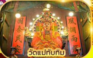
วัดแม่ทับทิม