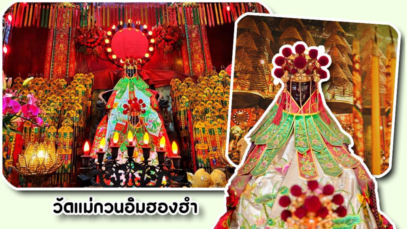
วัดแม่กวณอิมสองฮำ

จากนั้นพาท่านเข้าไปไหว้ขอพร วัดแม่กวณอิมสองฮำ วัดเก่าแก่ของฮ่องกงสร้างตั้งแต่ปี ค.ศ .1873 เป็นวัดขนาดเล็กที่มีชาวฮ่องกงศรัทธานับถือกันเป็นอย่างมากวัดแห่งนี้เป็นที่ประดิษฐาน องค์เจ้าแม่กวณอิมสองฮำ ที่มีชื่อเสียงเรื่องการให้กู้ยืมเงินเชื่อกันว่าท่านช่วยพลิกฟื้นเศรษฐกิจของชาวฮ่องกง ผู้คนจึงนิยมมาเยี่ยมเงินทำธุรกิจจนสำเร็จ ร่ำรวย รุ่งเรืองโดยให้ท่านอธิษฐานขอพรต่อหน้า เจ้าแม่กวณอิมสองฮำพร้อมกับระบุวันเวลาในการขอพรด้วย จากนั้นนำธูปธูปตามฐานะและศรัทธาที่เราจะนำเป็นสื่อในการขอพร เขียนจำนวนเงินที่ต้องการลงไปด้วย ใส่สกุลเงินยิ่งดีใหญ่ แล้วนำเงินใส่ในซองแดง ควรเตรียมซองแดงไปเอง นำซองแดงไปวนรอบกระถางรูป วนขวาจำนวน 3 ครั้ง แล้วเก็บซองแดงในกระเป๋าสตางค์ เป็นเงินขวัญถุง ถ้าประสบความสำเร็จตามที่มุ่งหวัง ให้นำเงินในซองแดงทำบุญหยอดตู้ที่วัดแห่งนี้ในโอกาสต่อไป