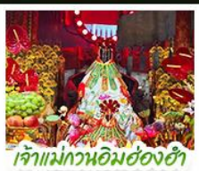
เจ้าแม่กวนอิมฮ่องกงฯ