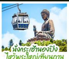
นั่งกระเช้าเองปัง ไหว้พระใหญ่เทียนถาน