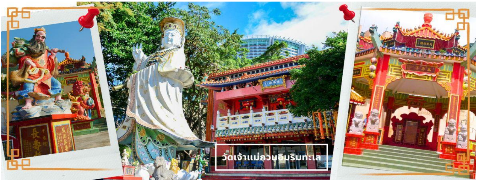
วัดเจ้าแม่กวนอิมริมทะเล

จากนั้นนำท่านเดินทางสู่ วัดเจ้าแม่กวนอิม อ่าวรีพัลส์เบย์ (REPULSE BAY) ตั้งอยู่ริมทะเล เป็นสถานที่ท่องเที่ยวสำคัญ สร้างขึ้นในปี ค.ศ.1993 วัดแห่งนี้ถูกสร้างขึ้นเพื่อคุ้มครองชาวประมงในการออกเรือไปหาปลา ซึ่งเป็นหนึ่งในวัดที่เก่าแก่ที่สุดของฮ่องกง บริเวณวัดจะมี เจ้าแม่กวนอิมองค์ใหญ่ ปางประทานพรตั้งอยู่ เป็นเทพที่ชาวฮ่องกงและคนจีนให้ความเคารพนับถือมากที่สุด สามารถขอพรได้ทุกเรื่อง วัดนี้เป็นที่นิยมมีนักท่องเที่ยวเดินทางมาขอพรกันมากมาย เพราะเชื่อในความศักดิ์สิทธิ์ และยังมี เจ้าแม่ทับทิม หรือเทพธิดาแห่งท้องทะเล องค์ใหญ่ ซึ่งคนฮ่องกง คนมาเก๊า และคนจีน ที่อยู่ริมทะเล ชาวประมง นักเดินเรือหรือผู้ที่เดินทางทางเรือเป็นประจำ จะนับถือเจ้าแม่ทับทิมเป็นอย่างมาก มีความเชื่อว่าเจ้าแม่ทับทิมจะปกป้องเราจากภัยอันตรายระหว่างการเดินทาง ภายในวัดยังมีเทพเจ้าและพระพุทธรูปต่างๆ ประดิษฐานไว้มากมายตามความเชื่อถือศรัทธา เช่น เทพเจ้าไฉ่ซิงเอี้ย ไหว้ขอโชคลาภความมั่งคั่ง ความร่ำรวย, พระสังกัจจายน์ โปริสสัตว์ เทพประทาน บุตร-ธิดา ไหว้อธิษฐานขอลูก, สะพานต่ออายุ (สะพานอายุยืน) สะพานสีแดงตั้งอยู่บนริมหาด สีแดงสด เชื่อกันว่า คนจีนเชื่อกันว่าหากเดินข้ามสะพานนี้ เราจะมีอายุยืนขึ้นอีก 3 วัน (3 วัน บนสวรรค์ = 3 ปี บนโลก