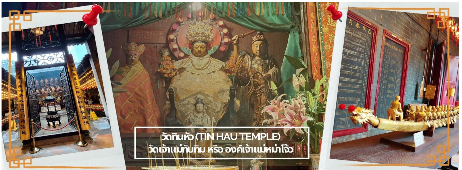
วัดทินหัว (TIN HAU TEMPLE) วัดเจ้าแม่ทับทิม หรือ องค์เจ้าแม่หม่าโจ้ว

จากนั้นนำท่าน ไหว้ขอพรเรื่องเดินทาง การติดต่อ ค้าขาย วัดเจ้าแม่ทับทิมทินหัว (Tin Hau Temple) ที่ Yau Ma Tei เป็นวัดเก่าแก่ขนาดเล็ก อายุกว่า 150 ปี มีต้นกำเนิดมาจากวัดเล็กๆ ใน พื้นที่ตลาด Kwun Chung เคยเป็นหมู่บ้านชาวประมงมาก่อน ตั้งแต่ปี 1864 เป็นวัดที่อุทิศให้กับทินโหว่ (หมาโจ้ เทพเจ้าแห่งท้องทะเล) มีบรรยากาศที่สงบ ร่มรื่น ติดกับสวนสาธารณะเล็ก ๆ และนักท่องเที่ยวยังไม่พลุกพล่านมากจุดเด่นที่แนะนำคือ การปิดทองเรือมังกร เพื่อการงาน การค้า ธุรกิจ ให้เจริญรุ่งเรือง