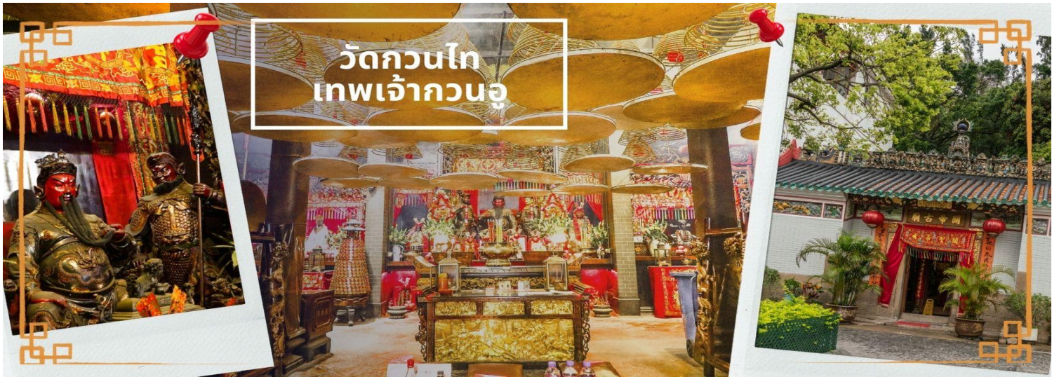
วัดกวนไท เทพเจ้ากวนอู

จากนั้นนำท่านเดินทางสู่ วัดกวนไท เป็นสถานที่ศักดิ์สิทธิ์อันเลื่องชื่อ ถือว่าเป็นวัดแห่งเดียวในเขตเกาลูน ที่สร้างขึ้นเพื่อบูชา เทพเจ้ากวนอู ซึ่งท่านเป็นเทพเจ้าแห่งความซื่อสัตย์ เปี่ยมไปด้วยคุณธรรม โดยศาลเจ้าพ่อกวนอูแห่งนี้ ผู้ที่มาไหว้สักการะจะนิยมขอพรเรื่องธุรกิจและบิรวาร เนื่องจากว่า เจ้าพ่อกวนอู เป็นเทพเจ้าที่รักษาคำพูดด้วยชีวิต รักคุณธรรม ซื่อสัตย์ ช่วยปกป้องสิ่งเลวร้าย อันตรายต่าง ๆ และช่วยเสริมอำนาจบารมีในการปกครอง ท่านมีจิตใจมั่นคง ตั้งขุนเขา มีสติปัญญาเป็นเลิศ และไม่ประมาท ท่านจึงเป็นสัญลักษณ์แห่งความเข้มแข็งโดดเด่น ไม่ครั้นคร้ามต่อศัตรู ฉะนั้นการมาบูชาขอพรท่าน จะช่วยเสริมดวงไม่ให้เพเลียงพลา้แก่ศัตรู ทำให้มีมิตรที่ซื่อสัตย์ และคุ้มครองบิรวารให้ก้าวหน้าและอยู่เย็นเป็นสุข ซึ่งผู้ประกอบการอาชีพ ตำรวจ ทหาร และ นักการเมือง จึงมักจะนิยมบูชาเทพเจ้ากวนอู เป็นพิเศษ