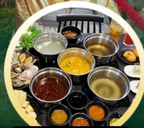
ซาบู้ฮองกง

02-04 มิ.ย. 18-20 มิ.ย. 07-09 มิ.ย. 20-22 มิ.ย. 13-15 มิ.ย. 25-27 มิ.ย. 14-16 มิ.ย. 28-30 มิ.ย.