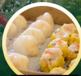
ตี๋มซ่าฮองกง