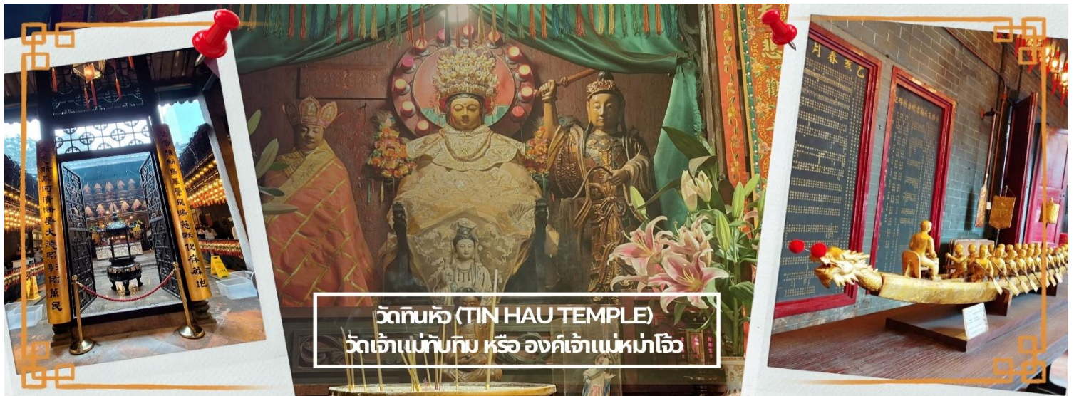
วัดทินหัว (TIN HAU TEMPLE) วัดเจ้าแม่ทับทิม หรือ องค์เจ้าแม่หมาจิ้ง

จากนั้นนำท่าน ไหว้ขอพรเรื่องเดินทาง การติดต่อ ค้าขาย วัดเจ้าแม่ทับทิมทินหัว (Tin Hau Temple) ที่ Yau Ma Tei เป็นวัดเก่าแก่ขนาดเล็ก อายุกว่า 150 ปี มีต้นกำเนิดมาจากวัดเล็กๆ ใน พื้นที่ตลาด Kwun Chung เคยเป็นหมู่บ้านชาวประมงมาก่อน ตั้งแต่ปี 1864 เป็นวัดที่อุทิศให้กับทินโหว่ (หมาจิ้ง เทพเจ้าแห่งท้องทะเล) มีบรรยากาศที่สงบ ร่มรื่น ติดกับสวนสาธารณะเล็ก ๆ และนักท่องเที่ยวยังไม่พลุกพล่านมากจุดเด่นที่แนะนำคือ การปิดทองเรือมังกร เพื่อการงานการค้า ธุรกิจ ให้เจริญรุ่งเรือง