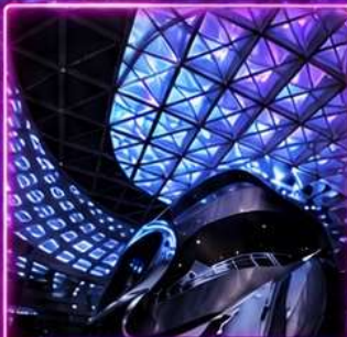
พิพิธภัณฑ์ศิลปะร่วมสมัยเซินเจิ้น (MOCAPE)