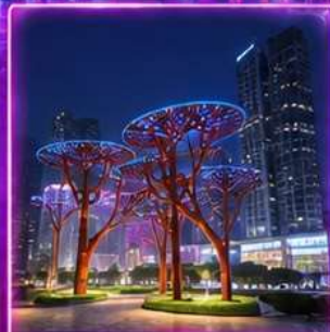
SHENZHEN CIVIC CENTER