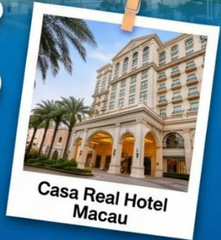
Casa Real Hotel Macau

แพ็คเกจสุดคุ้ม พักหรู 4 ดาวพร้อมอาหารเช้าที่ Casa Real Hotel Macau