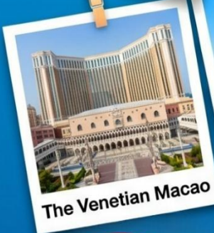
The Venetian Macao