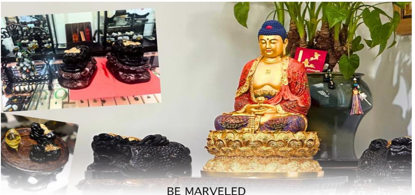
BE MARVELED ศูนย์ปี่เซี่ยะ

และนำท่านชม ศูนย์ปี่เซี่ยะ ซึ่งคนจีนนั้น ถือว่าหยกเป็นหิน ที่เป็นตัวแทนของความสวยงามและความบริสุทธิ์มีความเชื่อว่าหยก มงคล ถ้าพกติดตัวไว้จะอายุยืนและสุขภาพดีมีสินค้ามากมายเกี่ยวกับหยก อาทิ กำไลหยก หรือสัตว์นำโชคอย่างปี่เซี่ยะ ให้ท่านได้เลือกซื้อเป็นของฝาก, ของที่ระลึก หรือของนำโชคแต่ตัวท่านเอง