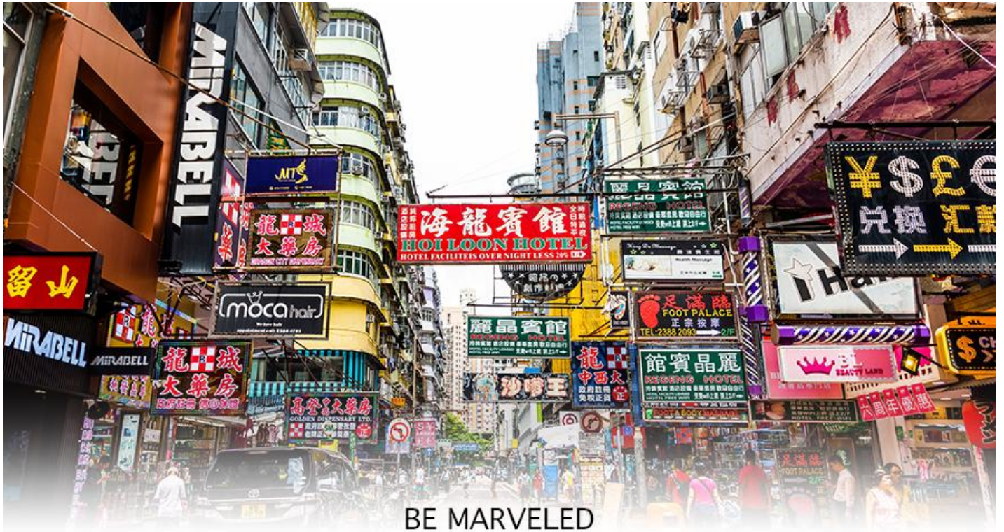
BE MARVELED MONGKOK

☉ อีสรอาหารอาหารเย็นตามอัชยาศัย **เพื่อความสะดวกในการช้อปปิ้ง**