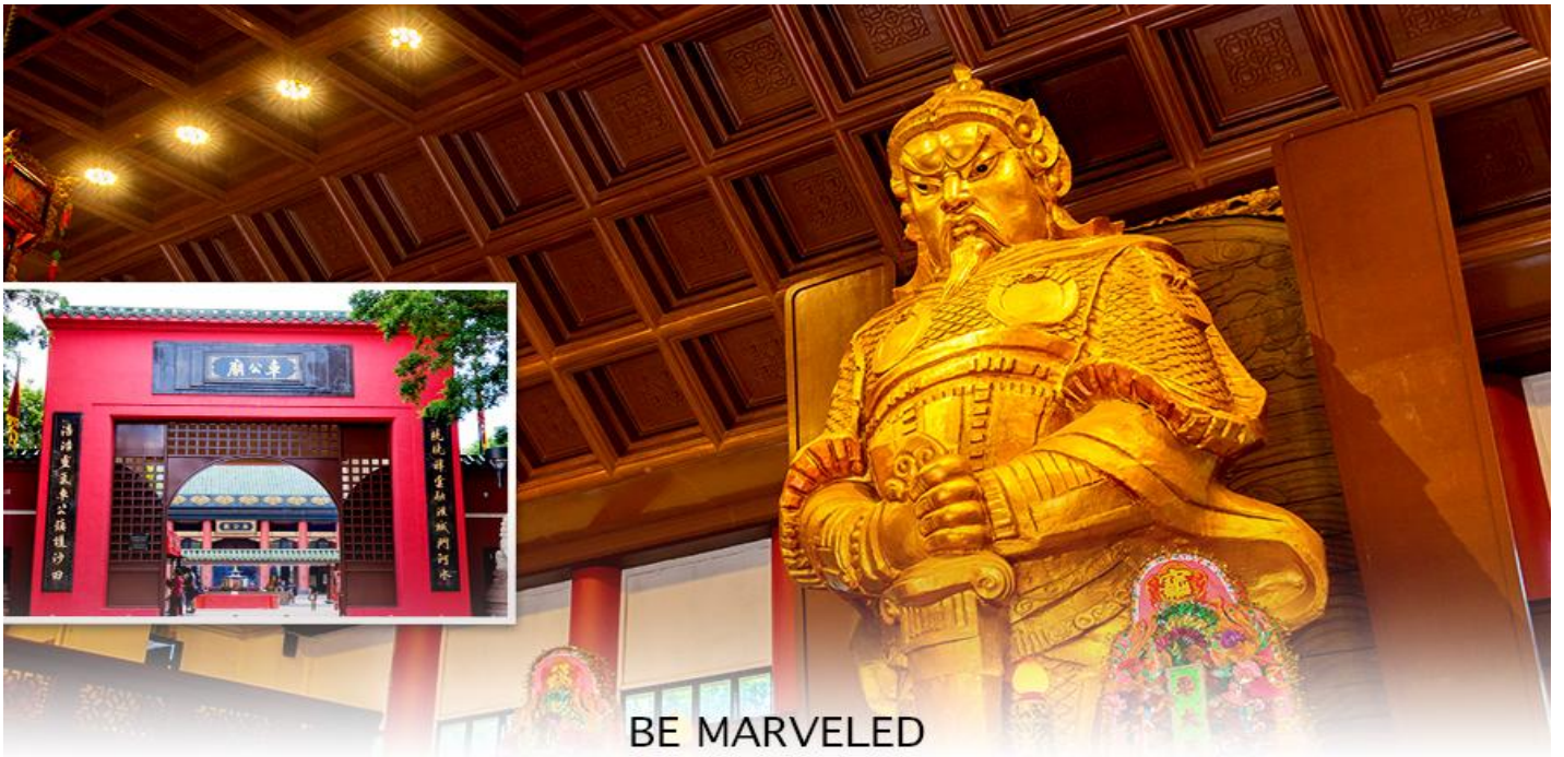
BE MARVELED วัดแชกง

นำท่านเดินทางสู่ วัดแชกงหมิว หรืออีกชื่อหนึ่งว่า “วัดกั๊กหันลม” หนึ่งในวัดดังของฮ่องกง ที่ประชาชนให้ความเลื่อมใสศรัทธามานาน ด้านในศาลจะมีรูปปั้นสูงใหญ่ของท่านแชกง ซึ่งเป็นเทพประจำวัดแห่งนี้ เชื่อ ว่าองค์ท่านศักดิ์สิทธิ์ในการขอพรด้าน โชคลาภ เสริมความเป็นสิริมงคล บัดเป่าเรื่องร้ายๆออกไป และวัดแห่งนี้ยังเป็น สถานที่ที่นิยมสำหรับท่านที่ต้องการแก้ปีชงอีกด้วย โดยวิธีการไหว้ขอพรจากท่านแชกงนั้น ท่านจะต้องเข้าไปยืนอยู่เบื้อง หน้ารูปปั้นของท่าน แล้วอธิษฐานขอพรพร้อมกับมองหน้าท่านอย่างมุ่งมั่นตั้งใจ จากนั้นให้ท่านทำพิธีหมูน “กั๊กหันแห่ง โชคชะตา” หรือ "กั๊กหันนำโชค" เพื่อหมูนรับแต่สิ่งดีๆ ให้เข้ามาในชีวิต