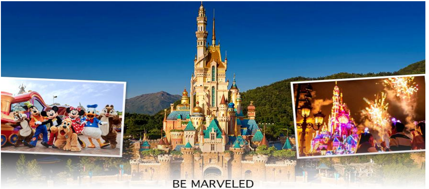
BE MARVELED HONG KONG DISNEYLAND

☺️ | อีศระอาหารเที่ยงและอาหารเย็น เพื่อความสะดวกในการช้อปปิ้ง