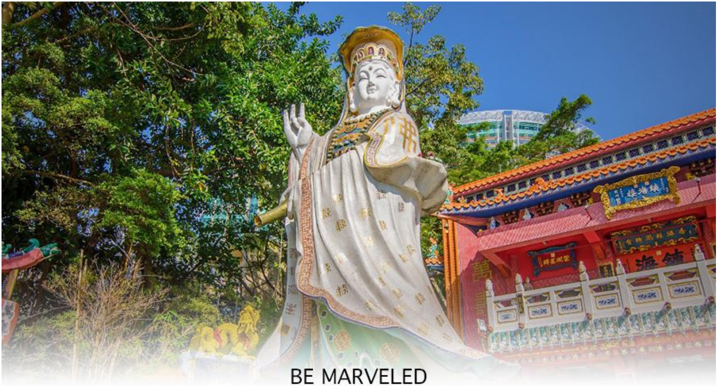
BE MARVELED วัดเจ้าแม่กวนอิมริปลัสเบย์