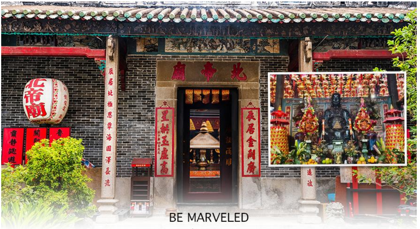
BE MARVELED วัดปักไต่

จากนั้นนำท่านขอปิ้ง ย่านมงก๊อก (MONG KOK) เป็นแหล่งช้อปปิ้งที่เต็มไปด้วยตรอกซอกซอยที่มี เอกลักษณ์แปลกตา รวมทั้งตลาดเก่าแก่ที่สะท้อนเสน่ห์และวิถีชีวิตของคนท้องถิ่น ถือเป็นหนึ่งในย่านยอดนิยมที่นักท่องเที่ยวทุกคนต้องแวะเวียนมา มีร้านสวยๆ บาร์เท่ๆ หลบซ่อนตัวอยู่มากมาย ภายในย่านมีตลาดนัด LADIES' MARKET ขนาดใหญ่ซึ่งมีร้านขายเสื้อผ้า เครื่องสำอาง รองเท้า กระเป๋า เครื่องประดับมากมาย อีกทั้งยังมีร้านอาหาร และเครื่องดื่ม ที่ขึ้นชื่อหลากหลายชนิด ให้ทุกท่าน ได้ลองลิ้มรสอีกมากมาย