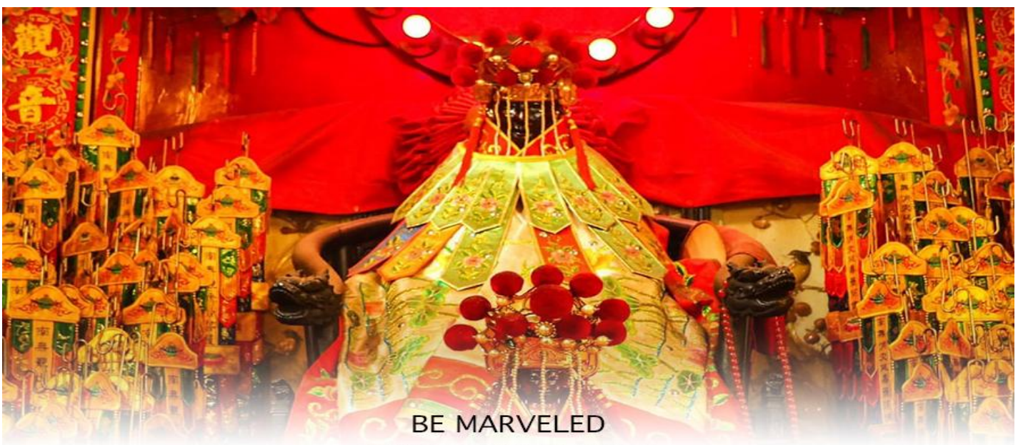
BE MARVELED วัดเจ้าแม่กวนอิมสองฮ่า (ยืมเงิน)

หลังจากนั้นนำทุกท่านเดินทางไปยัง วัดเจ้าแม่กวนอิมสองฮ่า วัดสองฮ่า เป็นหนึ่งในวัดที่เก่าแก่ที่สุดของฮ่องกง และชาวฮ่องกงเลื่อมใสกันมาก สร้างขึ้นในปี ค.ศ.1873 ในสมัยช่วงสงครามโลกครั้งที่ 2 มีการปล่อยระเบิดลงบริเวณใกล้เคียงกับวัดแห่งนี้หลายต่อหลายครั้ง ทำให้มีผู้บาดเจ็บและล้มตายมากมาย แต่ชาวบ้านที่หนีเข้าไปหลบภัยในวัดนี้ก็กลับปลอดภัยอย่างปาฏิหาริย์ และตัววัดก็ไม่ได้ได้รับความเสียหายจากเหตุการณ์ที่ระเบิดอย่างน่าอัศจรรย์ ตามความเชื่อของคนจีนใน ฮ่องกง-มาเก๊า จะมี "วันเปิดทรัพย์" หรือ "พิธียืมเงิน เจ้าแม่กวนอิมฮ่องกง" เป็นวันที่จะมาขอพรและยืมเงินเจ้าแม่กวนอิมซึ่งนับจากหลังวันตรุษจีนไป 26 วัน จะเป็นวันเปิดทรัพย์ที่จัดขึ้นในทุกๆปี พิธีนี้จะมีเพียงครั้งปีละครั้งเท่านั้น เป็นวันสำคัญอีกวันที่คนฮ่องกงมาไหว้ขอพรอย่างไม่ขาดสาย