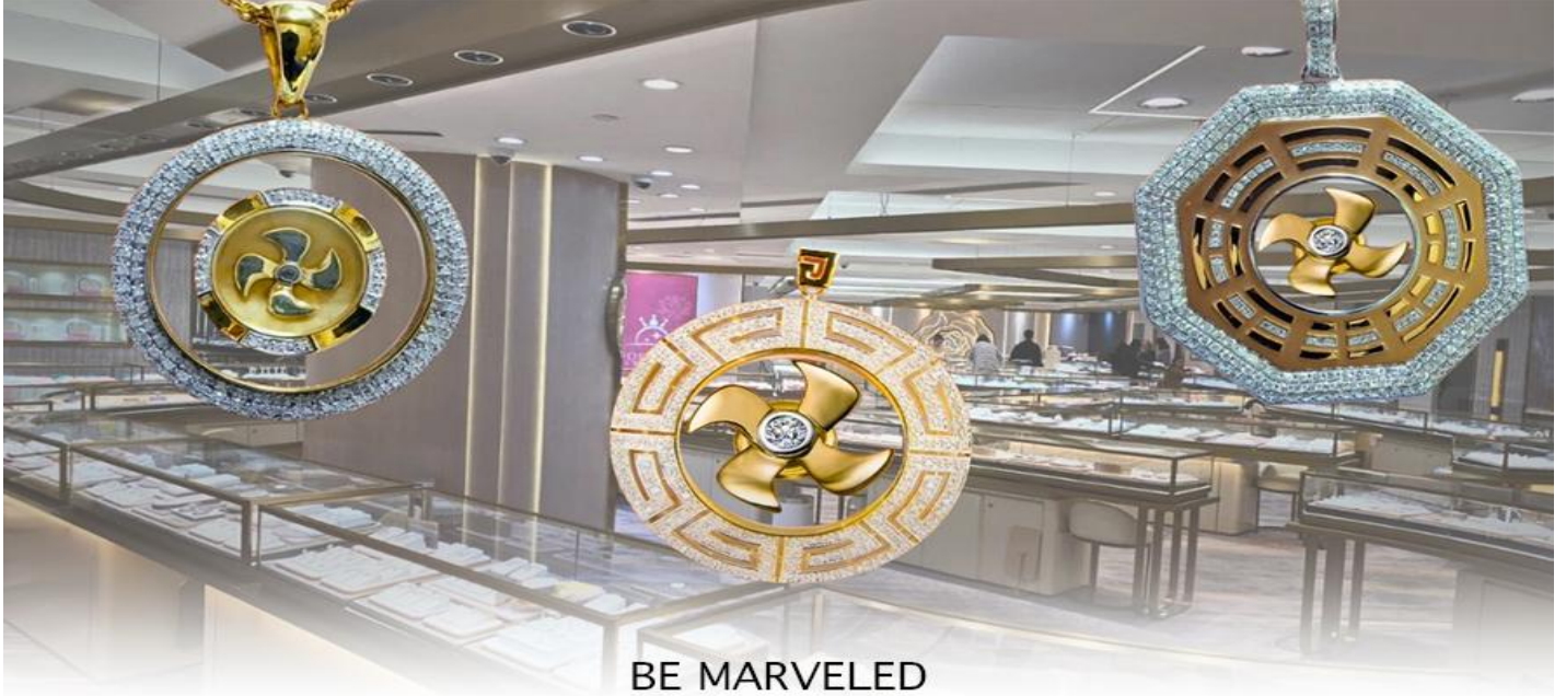
BE MARVELED ศูนย์ฮวงจุ้ย กังหันเศรษฐี

นำท่านชม ศูนย์ฮวงจุ้ย กังหันเศรษฐี ที่ขึ้นชื่อของฮ่องกง ท่านจะได้พบกับงานดีไซน์ที่ได้รับรางวัลยอดเยี่ยม และใช้ในการเสริมดวงเรื่องฮวงจุ้ย ศูนย์ฮวงจุ้ยกังหันเศรษฐี วัดแขก" ไม่ใช่ชื่อวัดโดยตรง แต่เป็นชื่อที่เกี่ยวข้องกับ วัดแขกหมิว (Che Kung Temple) ในฮ่องกง ซึ่งเป็นที่รู้จักกันดีในเรื่อง กังหันนำโชค ที่เชื่อว่าสามารถหมุนปัดเป่าสิ่งชั่วร้ายและนำโชคลาภเข้ามาในชีวิต