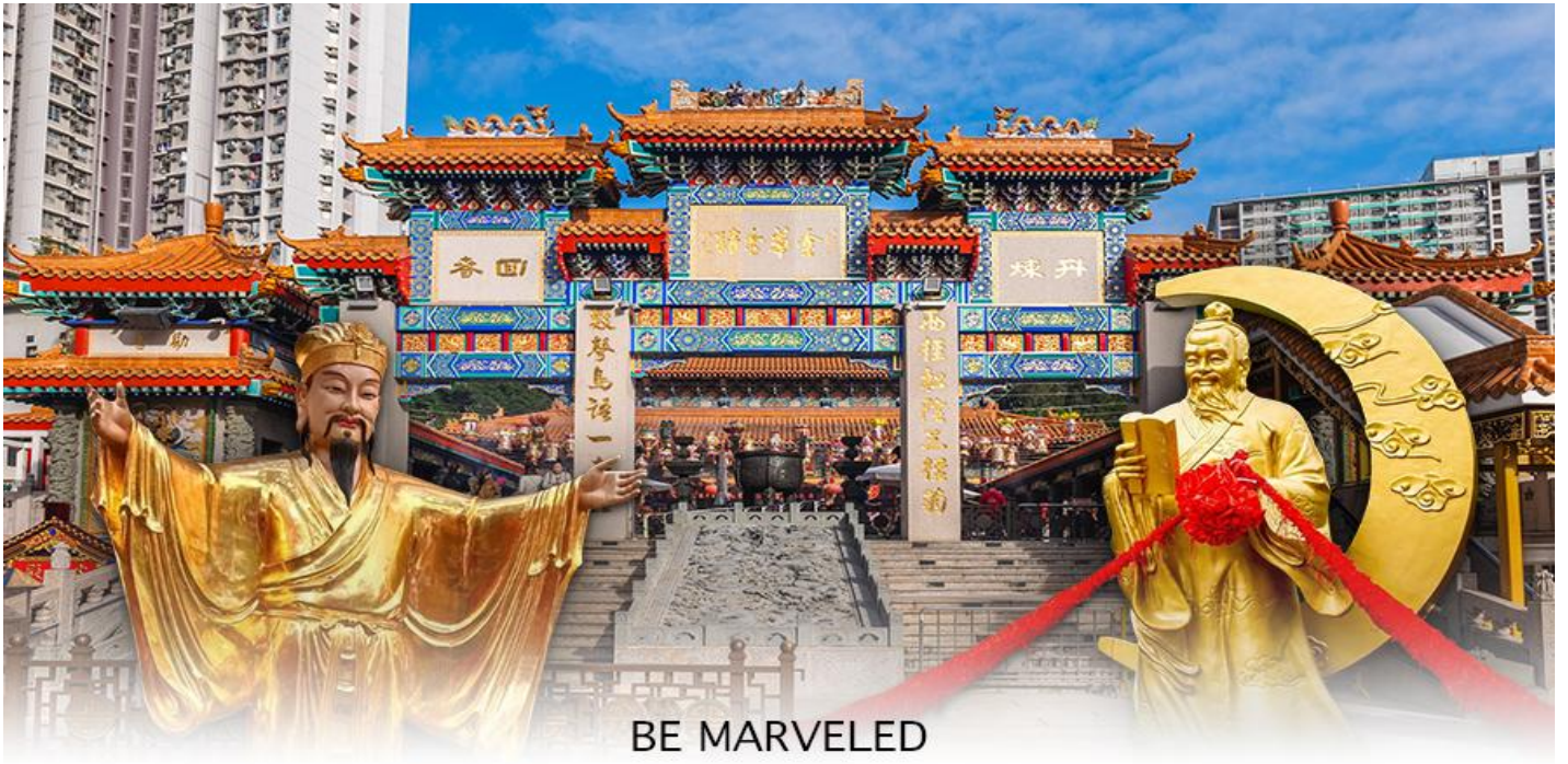
BE MARVELED วัดหวังต้าเซียน

หลังจากนั้นนำทุกท่านเดินทางไปยัง วัดเจ้าแม่กวนอิมสองฮ่า วัดสองฮ่า เป็นหนึ่งในวัดที่เก่าแก่ที่สุดของฮ่องกง และชาวฮ่องกงเลื่อมใสกันมาก สร้างขึ้นในปี ค.ศ.1873 ในสมัยช่วงสงครามโลกครั้งที่ 2 มีการปล่อยระเบิดลงบริเวณใกล้เคียงกับวัดแห่งนี้หลายต่อหลายครั้ง ทำให้มีผู้บาดเจ็บและล้มตายมากมาย แต่ชาวบ้านที่หนีเข้าไปหลบภัยในวัดนี้ก็กลับปลอดภัยอย่างปาฏิหาริย์ และตัววัดก็ไม่ได้ได้รับความเสียหายจากเหตุการณ์ที่ระเบิดอย่างน่าอัศจรรย์ ตามความเชื่อของคนจีนใน ฮ่องกง-มาเก๊า จะมี "วันเปิดทรัพย์" หรือ "พิธียืมเงิน เจ้าแม่กวนอิมฮ่องกง" เป็นวันที่จะมาขอพรและยืมเงินเจ้าแม่กวนอิมซึ่งนับจากหลังวันตรุษจีนไป 26 วัน จะเป็นวันเปิดทรัพย์ที่จัดขึ้นในทุกๆปี พิธีนี้จะมีเพียงครั้งปีละครั้งเท่านั้น เป็นวันสำคัญอีกวันที่คนฮ่องกงมาไหว้ขอพรอย่างไม่ขาดสาย