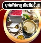
บุฟเฟ่ต์ชาบู เบียร์ไม่อั้น!!