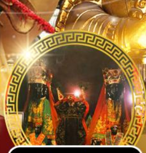
วัดหมู่บ้านโभव