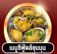
เมนูซีฟู้ดลิ้นมุน