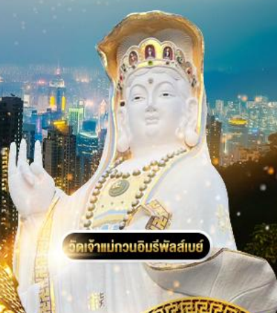
วัดเจ้าแม่กวนอิมรัฟัสสเบย์