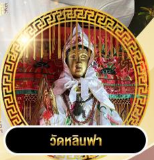
วัดหลินฟา