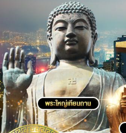
พระใหญ่เทียนถาน