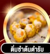
ต้มชาตันตำรับ