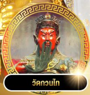
วัดกวนโถ