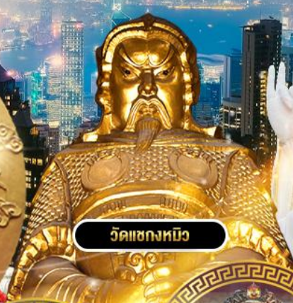
วัดเข่งหนิว