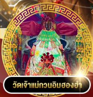
วัดเจ้าแม่กวนอิมสองฮา