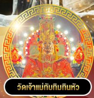
วัดเจ้าแม่ทับทิมกิมหัว