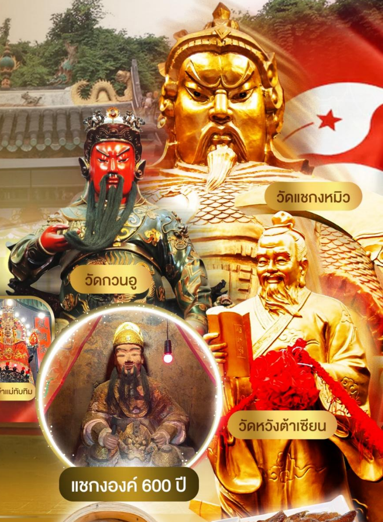
วัดเซกหมิว