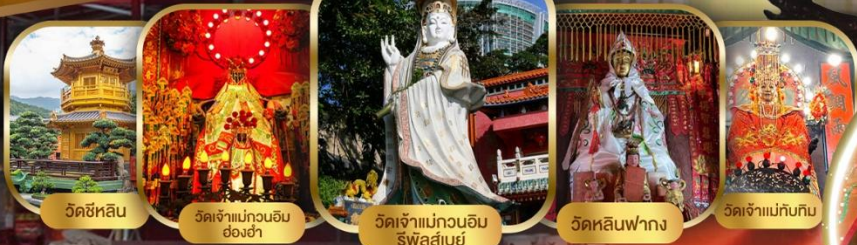
วัดชี่หลิน